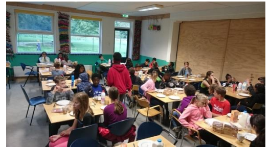
Benthe groep 8b

koekjes zouden vinden in het donkere bos. Er was ook nog 1 obstakel er was een KOEKIEMONSTER en als die je vindt moet je al je koekjes inleveren en begin je opnieuw. Dan zou je denken je weet toch waar ze staan? Maar nee dus, ze wisselen van plekken en van koekjes. Ondanks mijn groepje niet heeft gewonnen was het heel erg leuk! Maar alleen de CORVEE had ik een hekkel!